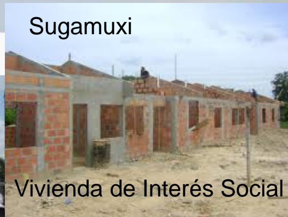
Vivienda de Interés Social