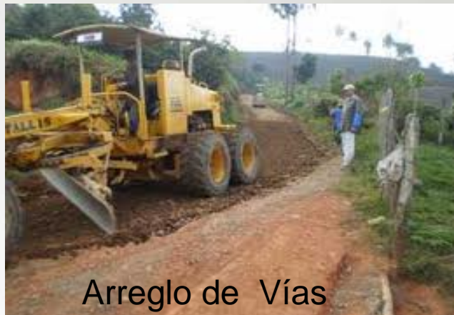
Arreglo de Vías