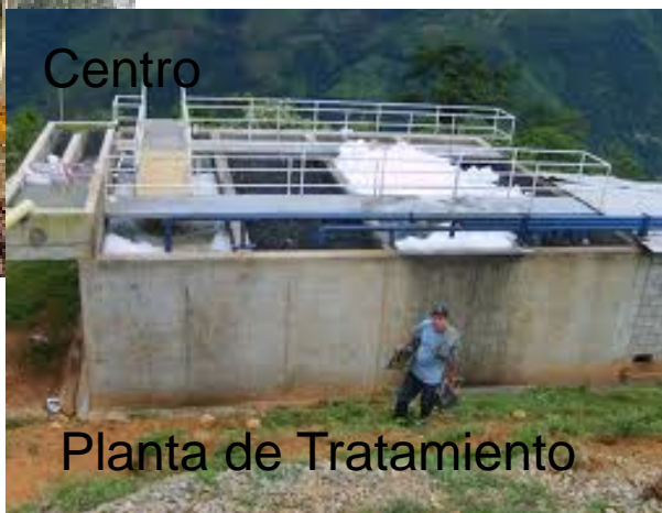
Planta de Tratamiento